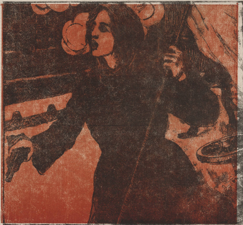
У баррикады. — Начало.