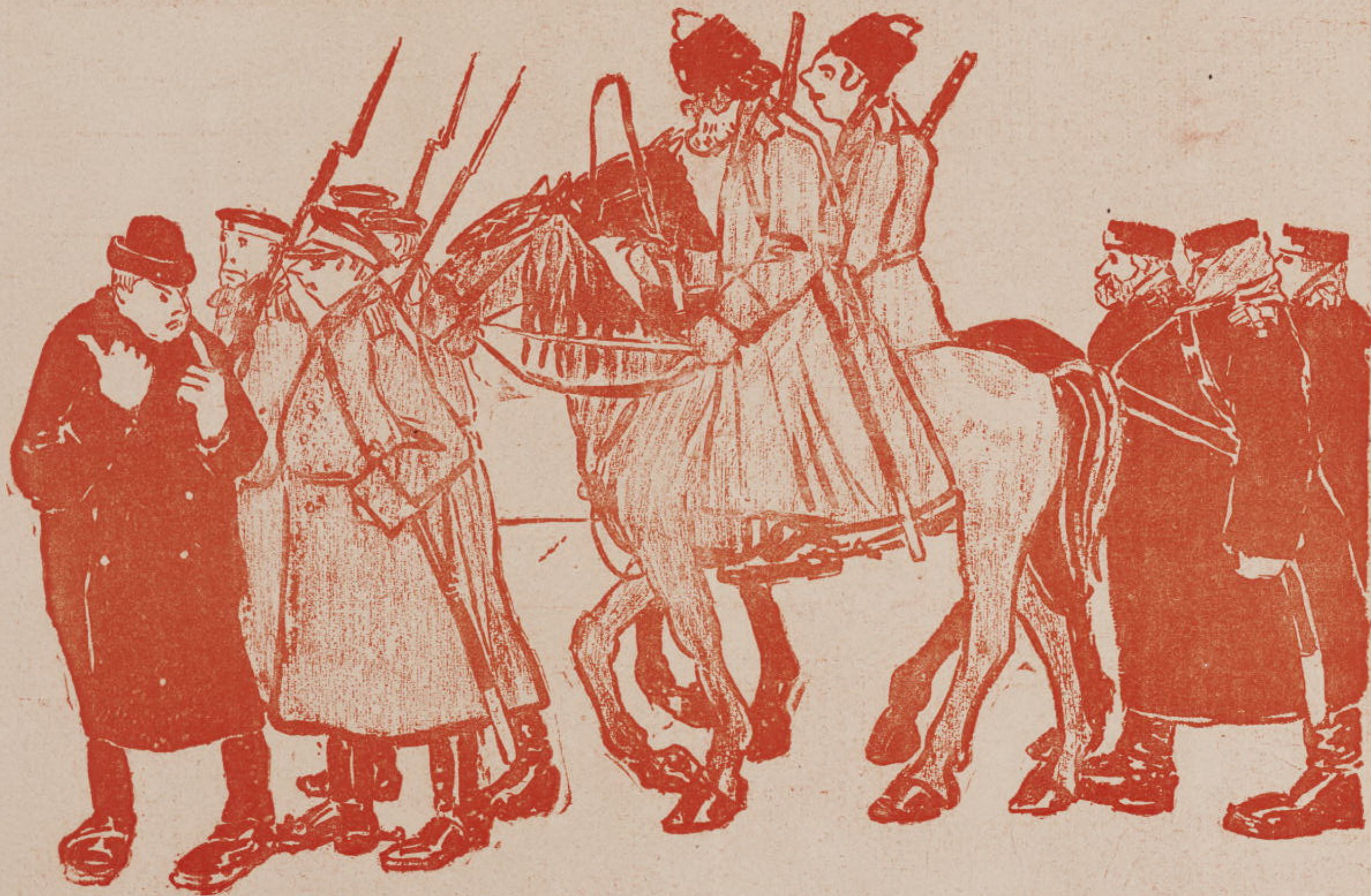
Первые ласточки грядущей забастовки.