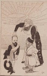
А ты не-тоже поговори!