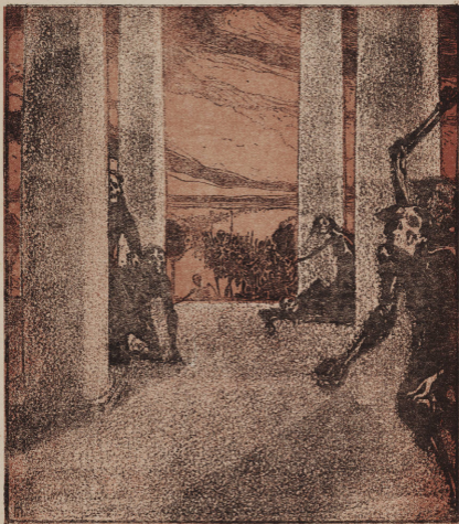
Головъ идетъ къ дворцанъ.