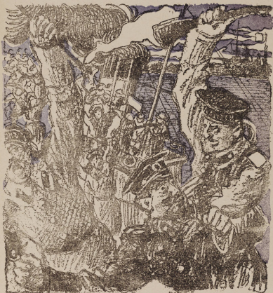
Рис. С. С.