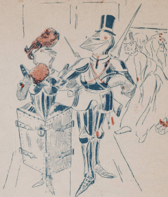
Безопасные костюмы для посетителей ресторана „Модернъ“.

Пробный № высыпается за двѣ 7-ми коп. морки.