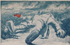
Ты проснешься-ль, исполненным силъ.