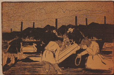
Вы жертвою пали въ борьбѣ революц...

Го графъ Ниродъ былъ, а теперь и графъ Иродъ обзавился.