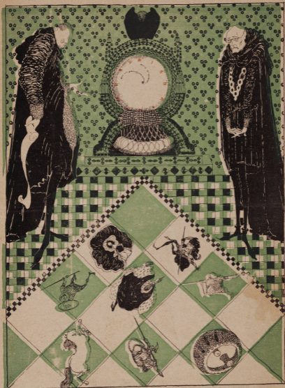
Шахматный турнирь. Страницка из средневекового альбома. Рис. худ. П.