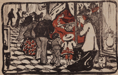
Въ музеѣ рѣдкостей. Рис. глѣ. Д.