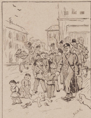
(Кавказскія жюны телеграммъ Т.к. телеграфнаго агентства, Кавказскія 10-го января).