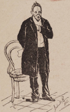
(карикатура, выдана отъ 15-го января театр. касс. Лезова). (Шутокъ 22-101).