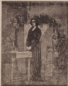
Марія-Антуанета въ тюрьмѣ.