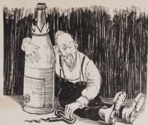
Изъ титова Максима Горькаго.

— Одна только ты скоро у меня, голубушка, и останешься.