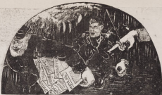
— Убрать эту... свободу!!

Его глотал, что шуха металла... И, как пророк, сердца он лижет... Хоть говорить он очень халд, Но, что ни скажешь, то... солжеть.