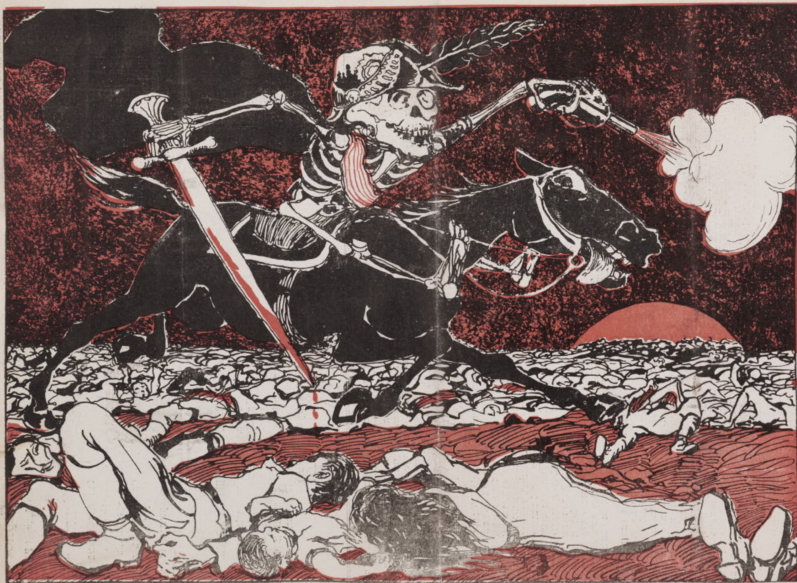
Реакція. — Ну, тепер, кажется, все тихо и покойно.