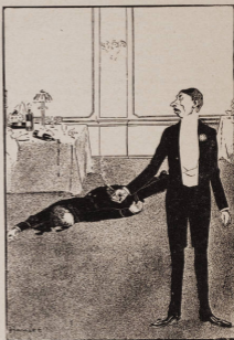
Первый „герекъ“ 1906 года.