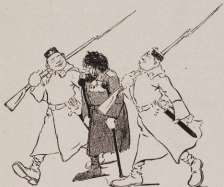
„Прошение милостыни строго воспрещается.“ (съ газет).

— Неужели, ты не знаешь, что газеты врутъ, а еще окончили институтъ, и думаешь какъ будто невинная.