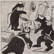
Шли три они...