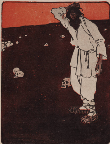
Рис. А. Шкумаев