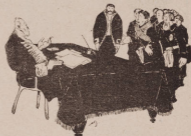
Рис. А. Добычин.

Витте (вспыхивая). Да, да, разрѣшаемъ. Я это и хочу сказать. Знаете, такой безтолковый у меня секретарь: вѣчно перепутаетъ бумаги. Что разрѣшено, что запрещено — ничего не разберешь.