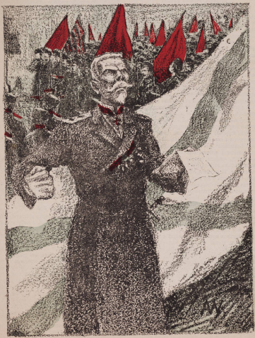
«АМИРАЛЪ БИРЮЛЬКИНЪ: «Ну побунтуй разъ, ну два,—но не до бѣсноты!»»