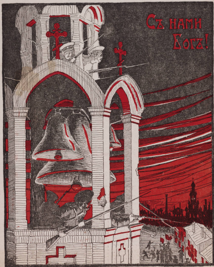
Москва. Демонъ 1905 г.