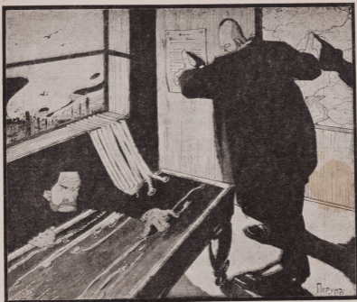
„Правительство занято проведением в жизнь начал, возмещенных в манифест 17 Октября“... (На Прямом Собрании от 18 Декабря).

Вз кристаллы мой бокаль? И злобу алчную зверей Кто разбудит во мнѣ? Встрѣяйте Новый год шумяй! Гоните стыдъ въ винѣ!