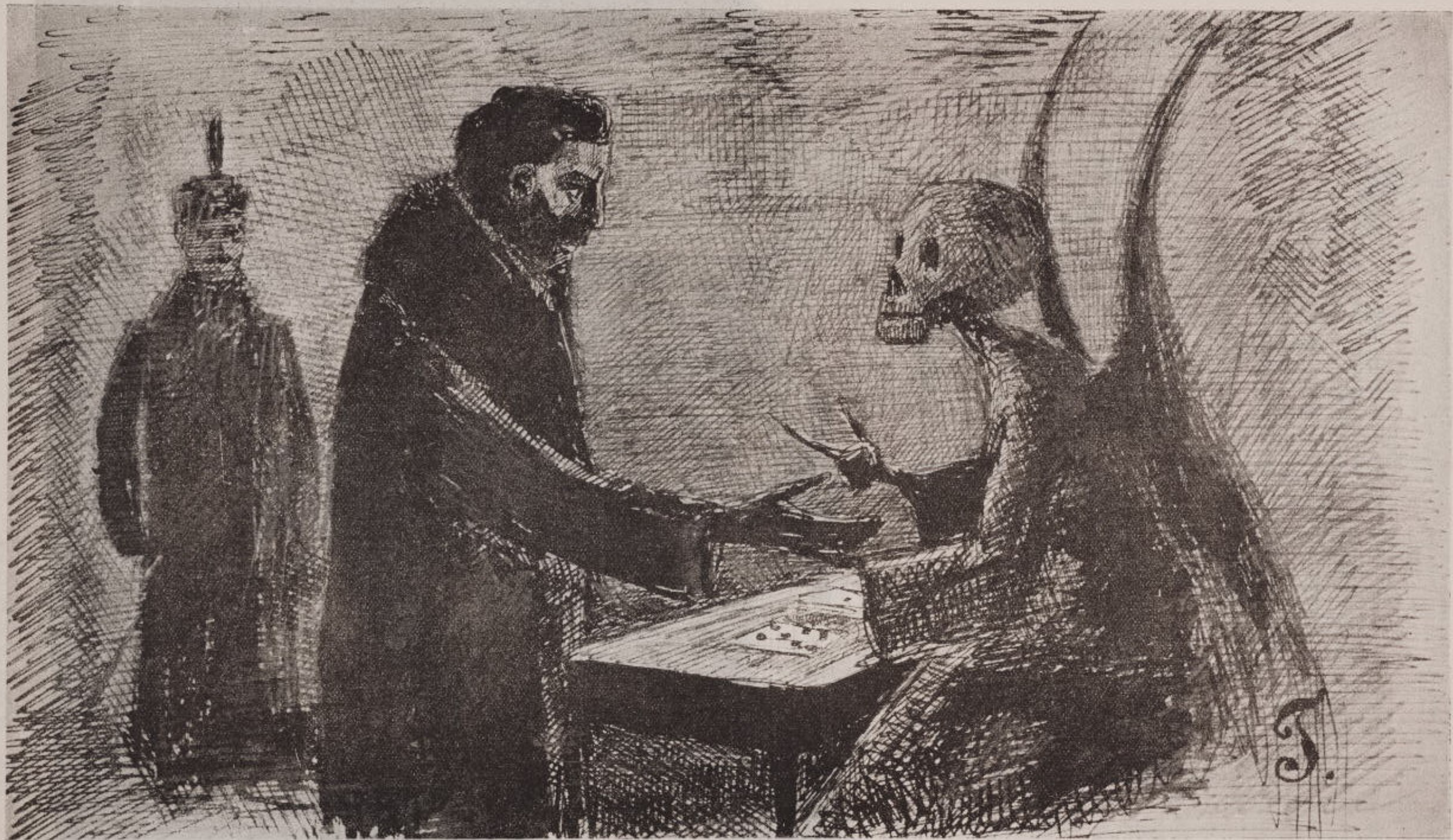
Что день грядущий мне готовитъ... (Изъ оп. „Евген. Онѣг.“).